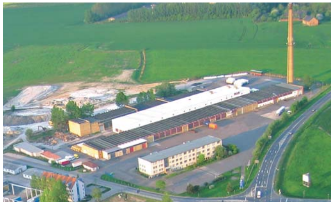
Die Tongrube und das Gewerbegebiet Taucha sind die neuesten Projekte der Firma Rösl am Standort in der Region Leipzig.

Liemehna, Pönitz und seit kurzem Taucha und Zschepplin sind die Standorte, an denen das Unternehmen aus dem Raum Regensburg mehr als zehn Jahren seine Produkte und Dienstleistungen im Nordosten von Leipzig anbietet. 35 feste Arbeitsplätze mit Tendenz steigend sind ein positiver Aspekt, „noch wichtiger ist, dass wir uns bestens in die Region integriert haben und mit allen Ansprechpartnern ein sehr gutes Verhältnis pflegen.“