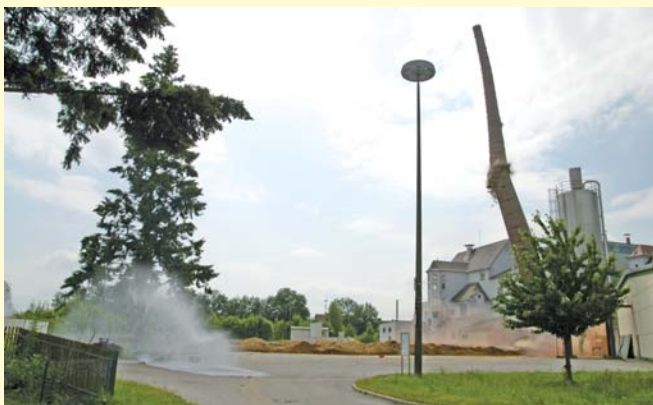
Seit 23. Juni fehlt auf dem Gelände der Südstärke GmbH in Sünching der Kamin: Er hat ausgedient und wurde fachmännisch per Sprengung zu Fall gebracht.